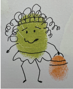
Ilustración: Cortesía del autor