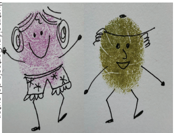
Ilustración: Cortesía del autor