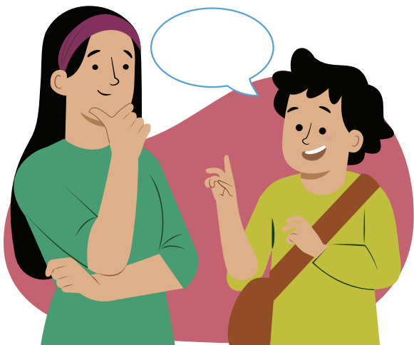
Ilustraciones por: Amelio Choché

El derecho a expresar tu propia opinión y que sea tomada en serio.