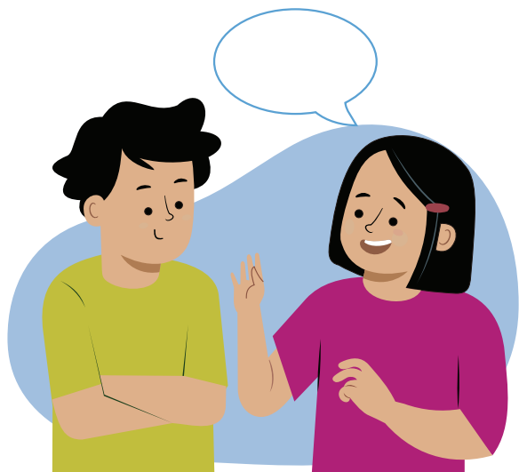
Ilustraciones por: Amelio Choché

El deber o la responsabilidad de escuchar a los demás con respeto.