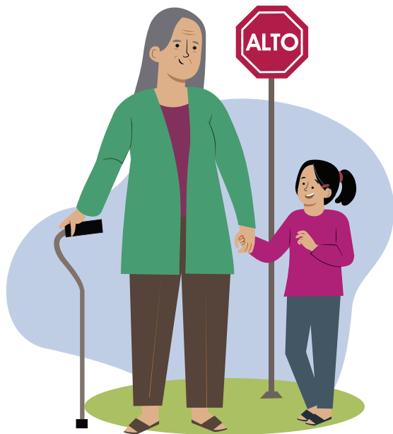
Ilustraciones por: Amelio Choché

La responsabilidad de prestar servicio a tu familia y a la comunidad.