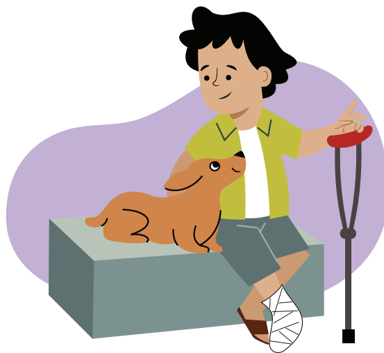
Ilustraciones por: Amelio Choché

La responsabilidad de ser la mejor persona que puedas llegar a ser.