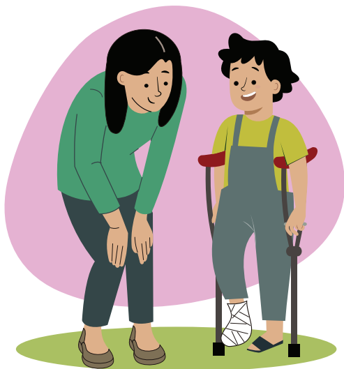
Ilustraciones por: Amelio Choché

El derecho a la protección contra la discriminación y a que los demás te traten con respeto.