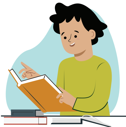
Ilustraciones por: Amelio Choché

La responsabilidad de mostrar respeto por tus maestros y otros.