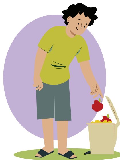
Ilustraciones por: Amelio Choché

La responsabilidad de cuidar de ti mismo y de NO desperdiciar.