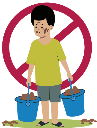
Ilustraciones por: Amelio Choché

El derecho a la protección contra el trabajo infantil.