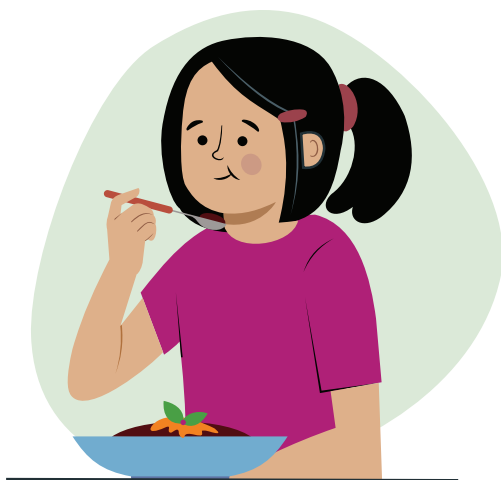
Ilustraciones por: Amelio Choché

La responsabilidad de cuidar de ti mismo y de NO desperdiciar.