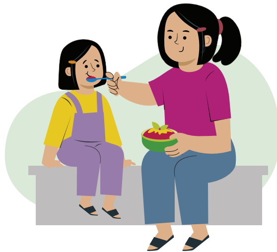
Ilustraciones por: Amelio Choché

La responsabilidad de mostrar amor y preocupación por los demás.