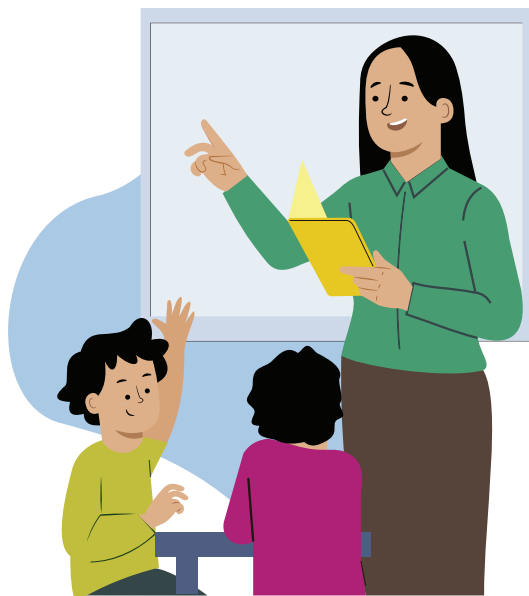
Ilustraciones por: Amelio Choché

La responsabilidad de mostrar respeto por tus maestros y otros.