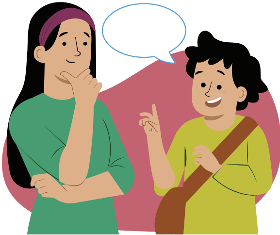
Ilustraciones por: Amelio Choché

El derecho a expresar tu propia opinión y que sea tomada en serio.