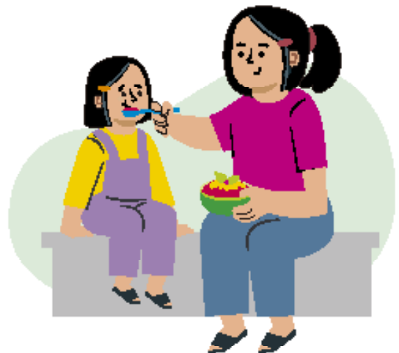
Ilustraciones por: Amelio Choché

La responsabilidad de mostrar amor y preocupación por los demás.