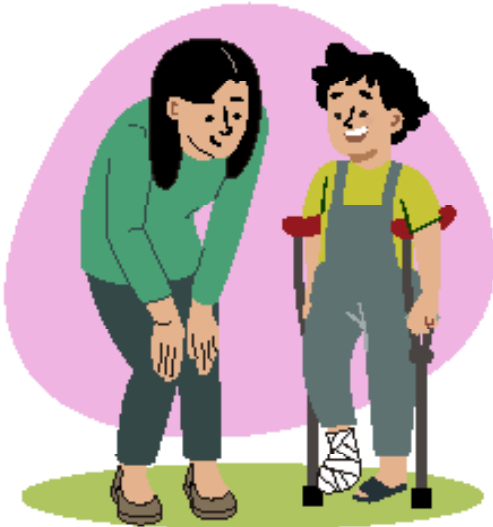
Ilustraciones por: Amelio Choché

El derecho a la protección contra la discriminación y a que los demás te traten con respeto.