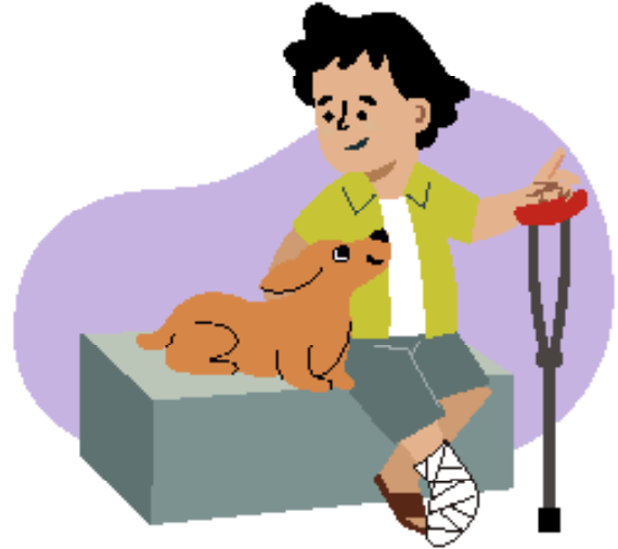
Ilustraciones por: Amelio Choché

La responsabilidad de ser la mejor persona que puedas llegar a ser.