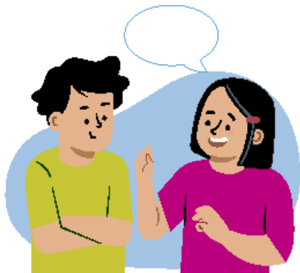
Ilustraciones por: Amelio Choché

El deber o la responsabilidad de escuchar a los demás con respeto.