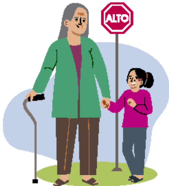
Ilustraciones por: Amelio Choché

La responsabilidad de prestar servicio a tu familia y a la comunidad.