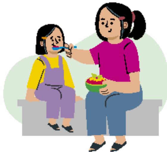
Ilustraciones por: Amelio Choché

La responsabilidad de mostrar amor y preocupación por los demás.