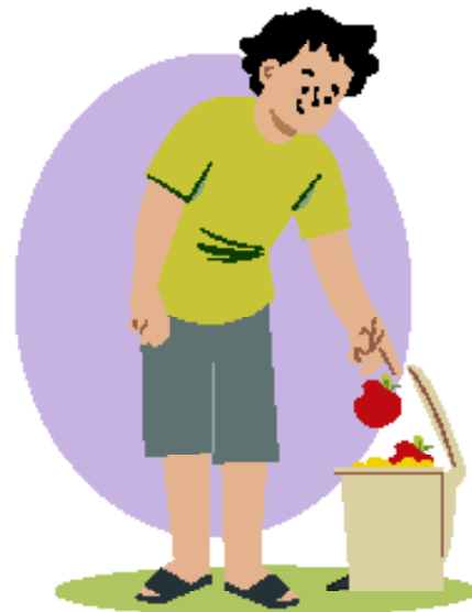
Ilustraciones por: Amelio Choché

La responsabilidad de cuidar de ti mismo y de NO desperdiciar.