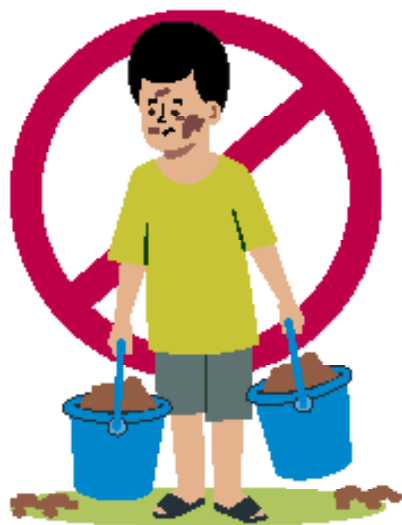
Ilustraciones por: Amelio Choché

El derecho a la protección contra el trabajo infantil.